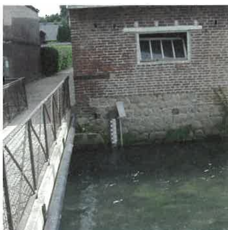
Station d'hydrométrie sur la Durdent à Vittefleury