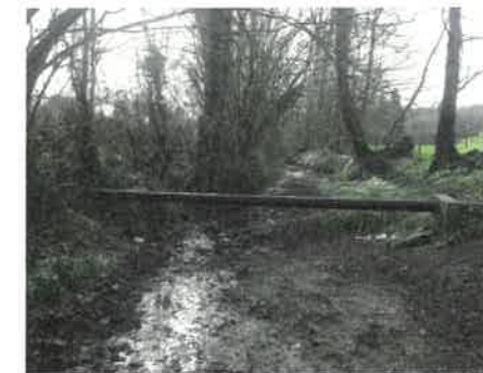
La Clérette le 17 mars 2017