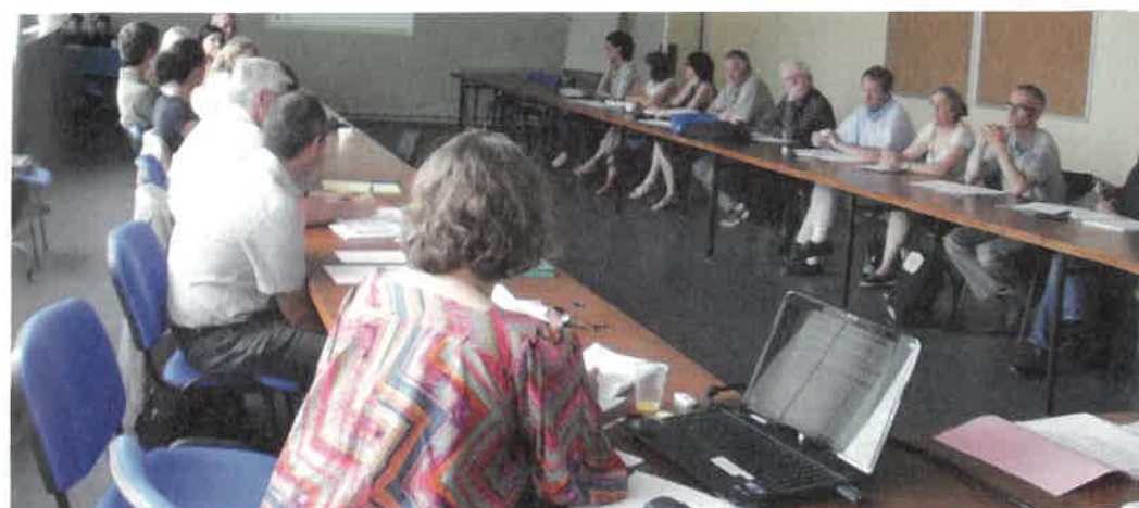
Réunion du comité sécheresse