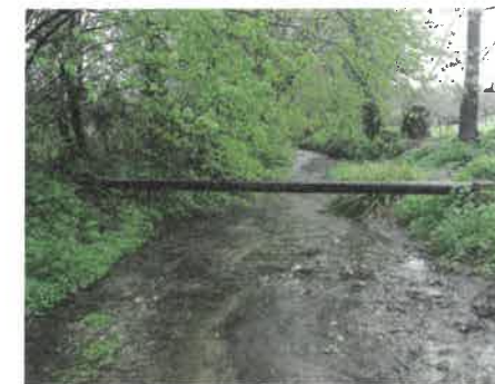
La Clérette le 25 avril 2012