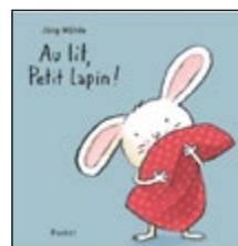
Au lit, petit lapin !