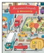
Mes premiers transports à découvrir