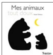
Mes animaux tout doux

En noir et blanc, adaptés pour les bébés :