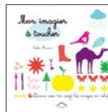
Mon imagier à toucher

Il est possible également de demander « un sac surprise ». La demande d'un sac littérature petite enfance, permet une diversité pour le jeune enfant.