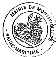
Jérôme DUBOST, Maire de Montivilliers