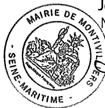
Jérôme DUBOST, Maire de Montivilliers