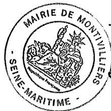
Jérôme DUBOST, Maire de Montivilliers